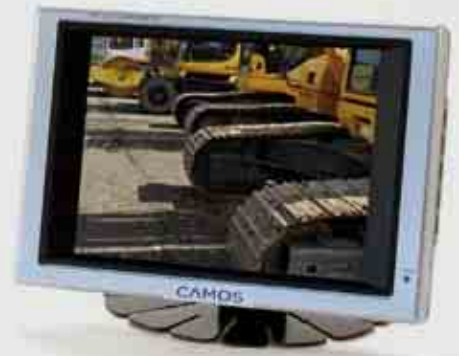
5,6" TFT LCD Farb-Monitor 5,6" TFT LCD Colour-Monitor

2 Kamera Eingänge 2 Camera Inputs Stromversorgung 12V / 24V Power Supply 12V / 24V