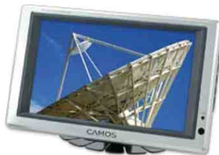
7" TFT LCD Farb-Monitor 7" TFT LCD Colour-Monitor

2 Kamera Eingänge 2 Camera Inputs Stromversorgung 12V / 24V Power Supply 12V / 24V inkl. Fernbedienung Remote Control