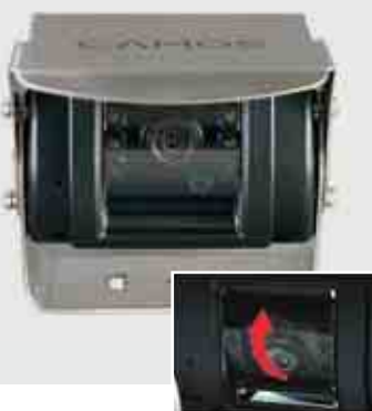
CM-42 Tilt Camera

Farb-Kamera mit 1/3" CCD Sensor und schwenkbarem Objektiv, 120° diagonalem Blickwinkel, IR-LEDs, Heizung u. Mikrofon