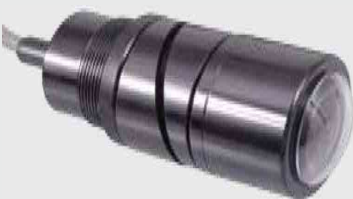
CM-10 Wide View

Kompakte Farb-Kamera mit 1/3" CCD Sensor und extrem weitem Blickwinkel von 170°, Heizung, Blendenautomatik