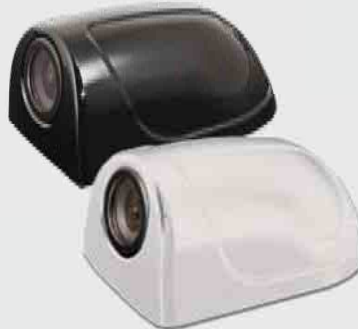
CM-110 Side Camera

Kompakte Farb-Kamera mit 1/4" CCD Sensor für diverse Einbauvarianten, 90° diagonalem Blickwinkel, Blendenautomatik