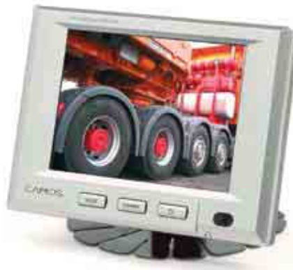
5" TFT LCD Farb-Monitor 5" TFT LCD Colour-Monitor

2 Kamera Eingänge 2 Camera Inputs Stromversorgung 12V Power Supply 12V inkl. Fernbedienung Remote Control