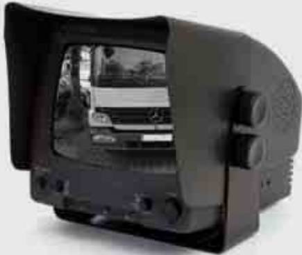
Schwarz-Weiß 5" CRT Monitor Black / White 5" CRT Monitor

2 Kamera Eingänge 2 Camera Inputs Stromversorgung 12V / 24V Power Supply 12V / 24V