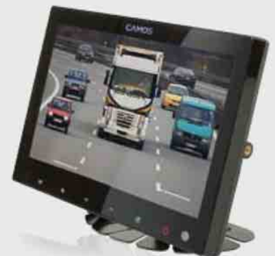
7" TFT LCD Farb-Monitor 7" TFT LCD Colour-Monitor

3 Kamera Eingänge 3 Camera Inputs Stromversorgung 12V / 24V Power Supply 12V / 24V inkl. Fernbedienung Remote Control