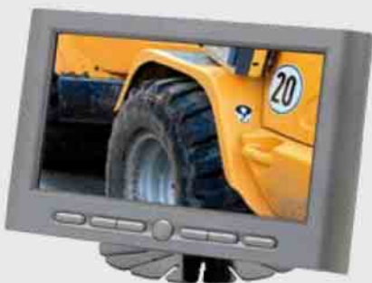
7" TFT LCD Farb-Monitor 7" TFT LCD Colour-Monitor

1 Kamera Eingang 1 Camera Input Stromversorgung 12V / 24V Power Supply 12V / 24V