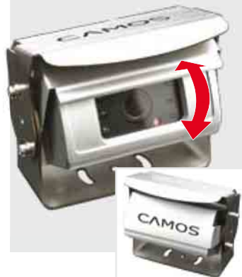
CM-46 Shutter Camera

Farb-Kamera mit 1/3" CCD Sensor und motorisierter Schutzklappe, 120° diagonalem Blickwinkel, IR-LEDs, Heizung u. Mikrofon